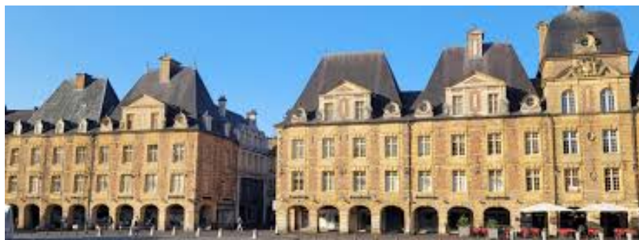
Grands magasins Jeanteur à Charleville-Mézières