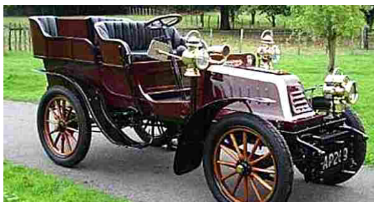
La Clément Tonneau de 1902