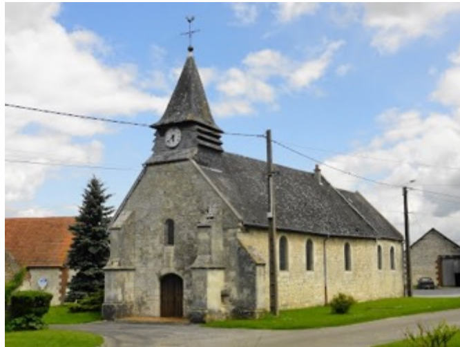
Église de Goudelancourt-lès-Pierrepont à 5h30 de marche de Voulpaix