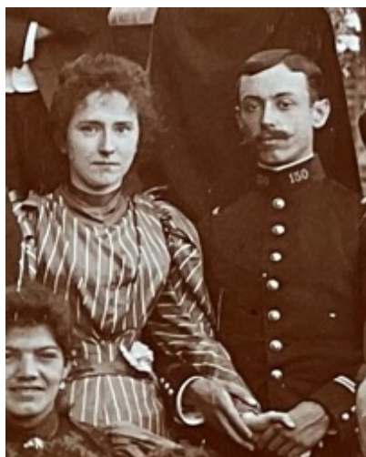
24 Août 1895, un mois et demi avant leur mariage.