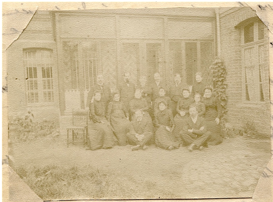
Bouchain 19 octobre 1902

Barnum 4 est venu à Valenciennes. André a vu avec beaucoup d'intérêt le montage et le démontage mais a eu plutôt une déception pour le reste ; il pensait y voir plus de nouveautés. Je n'y suis pas allées ( sic ).