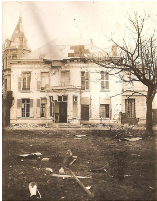
La Briquette après la guerre