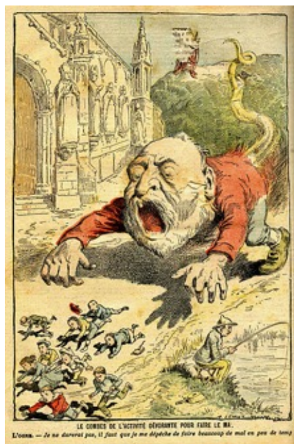
L'ogre Émile Combes, Le Pèlerin, 27 juillet 1902.