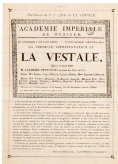
Illustration 23: Fac-Simile de l'affichette de la première exécution de La Vestale à Paris le 15 décembre 1807, suivi d'un extrait des Grotesques de la musique de Berlioz insérés à l'intérieur du livret-programme du concert du 18 décembre 1904 donné par l'Orchestre et chœur d'Amateurs. Auguste Gaudefroy, L'Orchestre et chœur d'Amateurs, suite , BmL, ms. B 159.

Donc Henri et tous ceux qui veulent venir (ce qui en vaut la peine, je le répète), sont invités dès maintenant et pour toujours à partager nos agapes fraternelles, avec lesquelles j'ai l'avantage d'être votre sœur pour la vie.