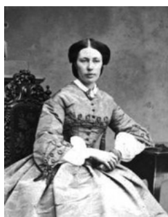
Décédée de 27 avril 1903